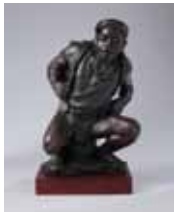
伊將 / 小米豐收 / 30×18×50cm / 銅 / 2002

跨越南北回歸線,到南島文化藝術重鎮樓包屋文化中心展覽,對台灣原住民當代藝術走入國際平台,是很重要的一步,也是高雄市立美術館深耕南島當代藝術展現成果的開始。本展覽共展出27位藝術家,52組件作品,並與原住民文化園區合作徵選4位藝術家至樓包屋文化中心駐館創作,讓本展覽展出樣貌更為豐富與多元。