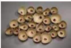
洛尼特·巴蘭格 / 群 / 40×55×10 cm×25 / 陶 / 2011

自從人類懂得用火，將泥土化為陶後，文明便有了長足的進展，並隨著科學與文化的發展，陶器在世界各地創造出各種美麗的形式，展現清純精煉的火藝與現代容器美學的藝術價值。「陶藝觀象：2012臺灣國際陶藝雙年展」乃是自2004年後，高美館第二次與新北市立鶯歌陶窯博物館合作，本展採作品競賽的方式選件，共吸引了來自54個國家、651位陶藝家參賽，並以「陶藝觀象」為主題，精選超過100件入選作品呈現於本次展覽中。「象」意指表現事物的種樣貌，藝術家在作品上表達有形外觀或無形意念的過程，正是一種「象」的實踐。藉由來自世界各國的精彩作品，展覽呈現了陶藝的萬象之美，並提供愛好陶藝的民眾，親自領會國際藝術家的蓬勃創意，同時一窺近年來陶藝創作的精彩表現。