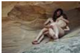
柯錫杰 / 懷抱 / 90×120cm / 數位輸出 / 2011

柯錫杰是六〇年代少數在美國商業廣告攝影界展露鋒芒的亞裔攝影師之一，1979年毅然放棄既有的成就，隻身遠赴南歐、北非等地，開創風格獨特的「心象風景」。他在八〇年代使用「轉染法」的攝影作品，大幅提升彩色攝影的藝術層次，引起國際攝影專業領域巨大的迴響；也為台灣現代攝影界帶來深遠的影響，被譽為「台灣現代攝影第一人」。柯錫杰以超脫的視野拍攝出宇宙萬物凝練之美，讓作品突破一般人對於「攝影」創作的有限想像。1962年柯錫杰第一次個展即在高雄舉辦，可謂在高雄踏出攝影的第一步，五十年後的今日，柯錫杰已是國際知名攝影師家，選擇回到高雄舉辦大型回顧展，對於柯錫杰以及高雄而言都具有非凡的意義。