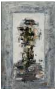
陳水財 / 都市肖像之二 / 畫布 / 1992 / 藝術家自藏

被譽為「高雄三支筆」之一的陳水財，在南台灣藝術界屬於重量級人物，其批判力道深厚且精準的藝術評論，對於90年代高雄現代藝術的發展和影響具有舉足輕重的關鍵性地位。陳水財不是閉門索居的隱士，他在都市人群之中，既參與事件，又超然度外，他對社會環境的犀利洞察，不只訴諸文字也投射在藝術創作的內容裡。他在1981年首次個展講桌上寫道：「怎麼樣的土壤長怎麼樣的植物，怎麼樣的因結怎麼樣的果，當我關注我們生存的土地時，便不再被傳統、現代、東方、西方這樣的問題所困擾。我對藝術的看法是展現對這塊土地最真切的感受。」在30年後的今日，這段話仍能貼切地概括陳水財對藝術的認知和創作思維。本展集結陳水財各時期代表作品餘百件，是首度完整呈現其創作歷程的展出。