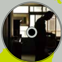
《叁陸仔的港都電影夢》