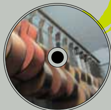
《不曾消失的吉他聲》