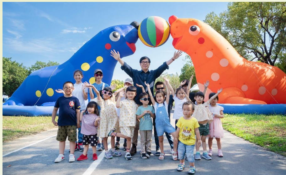
海洋狂想曲 歡樂大冒險 113.4.4-4.7